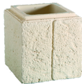
Boisseaux RENAISSANCE L. 30 x l. 30 x H. 30 cm L. 37 x l. 37 x H. 33 cm L. 47 x l. 47 x H. 33 cm