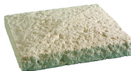
Chapeau de pilier BRIDOIRE L. 42 x l. 42 x h. 7 cm