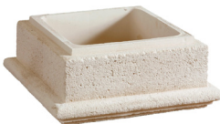
Collerette VALANCAY L. 40 x l. 15 x H. 7 cm