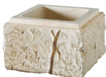
Boisseaux BRIDOIRE L. 167 x H. 20 cm