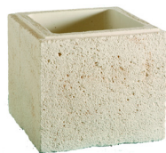
Boisseaux VALANCAY L. 35 x l. 35 x H. 30 cm